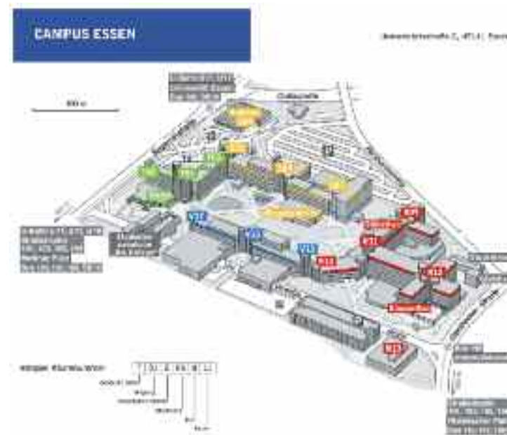
Karte Seite 1: „Ruhr Tourismus“